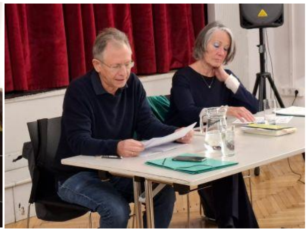
Lesung Doron Rabinovici aus seinem Buch „Die Einstellung“ am 22.11.2025 im transform!Saal,1040 Wien