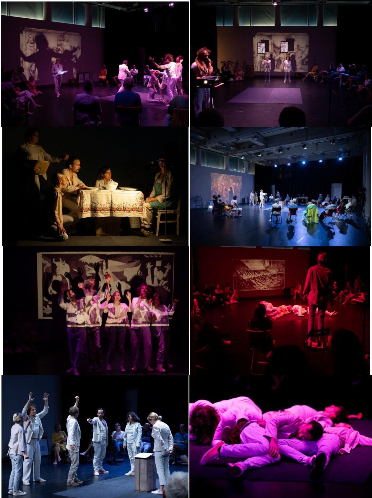
Performance im Seestadt Studio, 24.6.2024