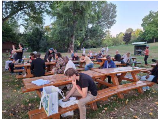
Konzert Prince Zeka &Band am 3.9.2025 auf der Donauparkbühne/1220 Wien