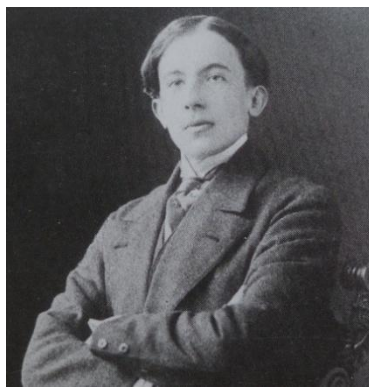
Marguerite Duras, Bertolt Brecht, Paul Eluard