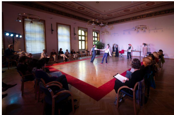
Fotos: Performance UBU BAABU:ANTI UBU am 13.5.2025 im Festsaal der BV Alsergrung