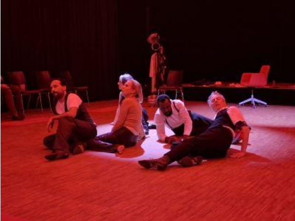
Performances UBU BAABU: ANTI UBU im Herbst 2025 in den Seestadt Studios/22.Bezirk, im Ballroom Some like it hot/15.Bezirk und in der HausWirtschaft/Nordbahnsaal/2.Bezirk