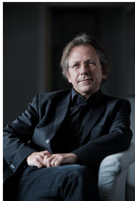
Doron Rabinovici