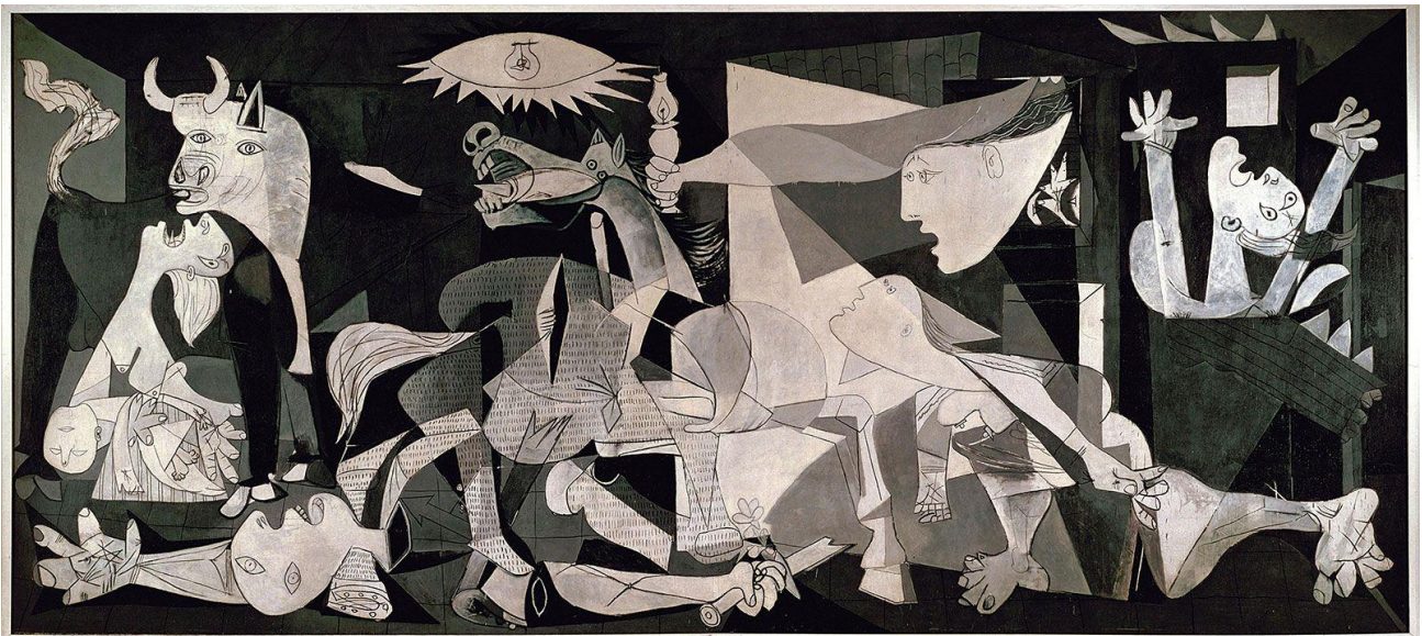
Pablo Picasso: Guernica (1937), Museo Nacional Centro de Arte Reina Sofía, Madrid.

Mit der französischen Revolution und ihren gesellschaftlichen Veränderungen hatte sich auch das Blickfeld der Kunst geändert. Waren bis dahin Künstler Angestellte des Adels oder des Klerus gewesen, mussten nun viele unter teilweise erbärmlichen Verhältnissen ihr Leben fristen. Dies führte auch zu einer Änderung in der Thematik der Kriegsdarstellungen. Während die traditionelle Malerei oft den Krieg als riesiges Spiel inszenierte, standen nun die Opfer im Fokus der Aufmerksamkeit. Im Sinne von Goyas Desastres de la guerra ( Die Schrecken des Krieges ) ging auch Picasso diesen neuen Weg: In Guernica gibt es keinen Helden, keinen Sieg des Guten, keine Täter, dafür aber die Apokalypse mit all ihren Grausamkeiten.