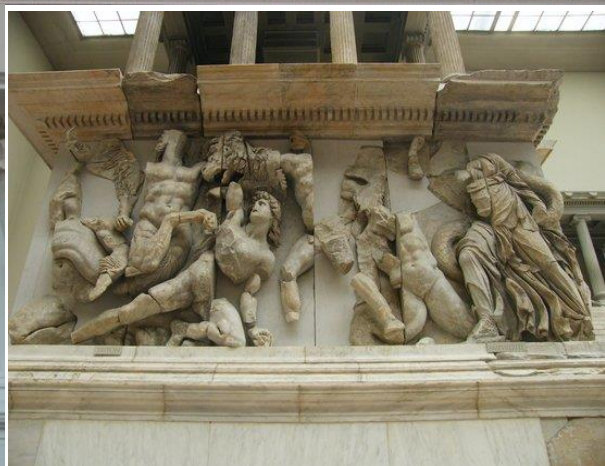
Obere Reihe: Rekonstruktion des Pergamonaltars in Vorderansicht; 2. Reihe links: Leto, die Mutter von Artemis, im Kampf mit einem tierhaften Giganten (Ostfries); 2. Reihe rechts: Rhea/Kybele reitet auf einem Löwen (Südfries); 3. Reihe links: Athene und Nike im Kampf gegen Alkyoneus (Ostfries); 3. Reihe rechts: Triton und seine Mutter Amphitrite im Kampf gegen die Giganten (Nordrisalit der Westseite)