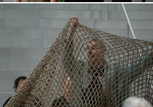
Ensemble in FRÜHSTÜCK MIT KASSANDRA 23, Probe in der Kulturgarage