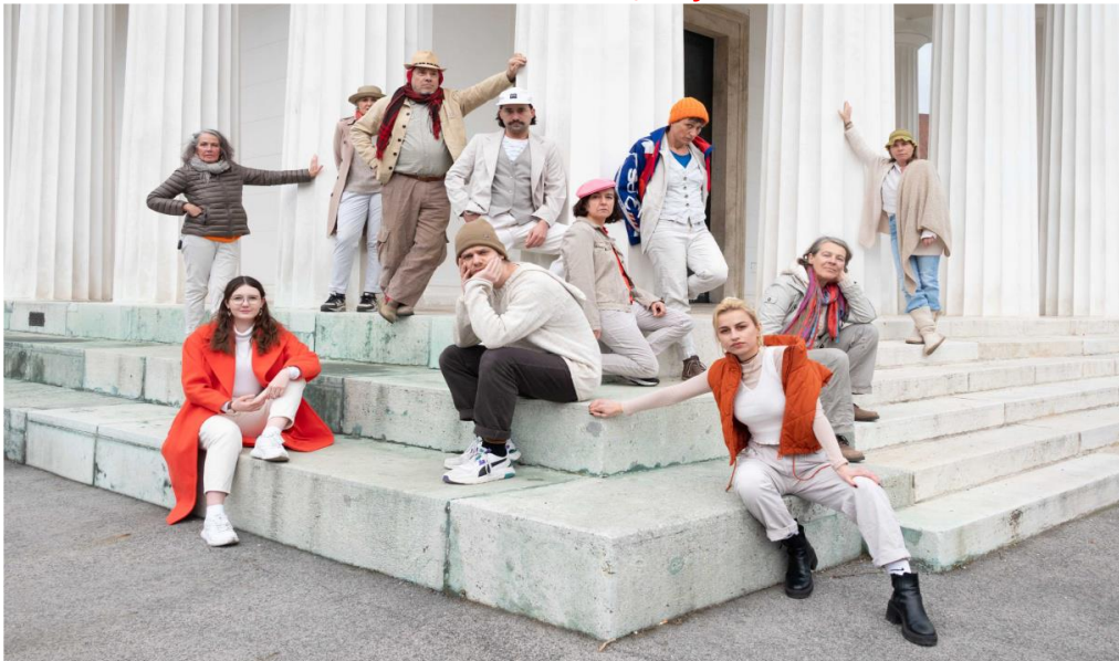
DU, AN DEINEM ORT, Performanceprojekt 2024

Orte: Seestadt Studios/Donaustadt, VHS Hietzing, transform!-Veranstaltungssaal/Wieden, SOHO-Studios/Ottakring, die HausWirtschaft/Leopoldstadt, KunstQuartier Wien Meidling, Alte Schieberkammer/Fünfhaus