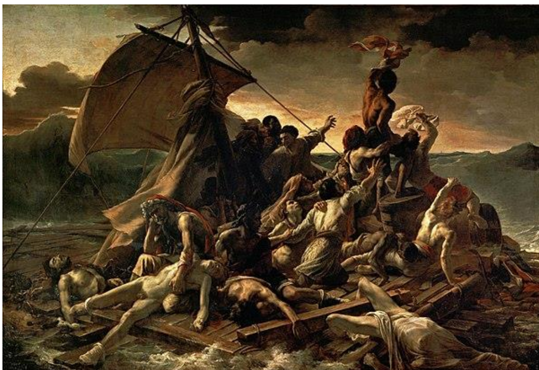
Théodore Géricault: Das Floß der Medusa (1819), Louvre, Paris