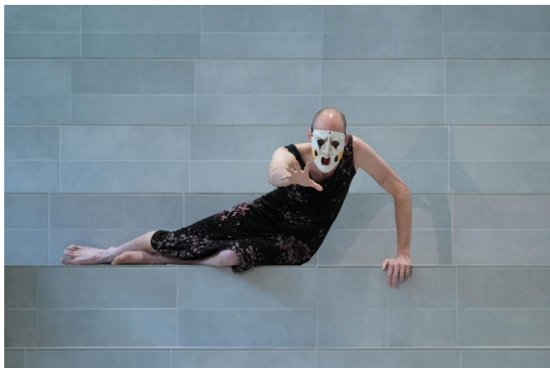
Ensemble in FRÜHSTÜCK MIT KASSANDRA 23 , Probe Kulturgarage im Mai 2023

Es gibt viele Menschen [...], die Kriegshetze gedankenlos mitmachen und die Lügen gar nicht erkennen. Sie wären sogar bestürzt, wenn sie plötzlich verstünden, dass das, was sie tun, bedeutet: den dritten Weltkrieg vorbereiten! Und vorbereiten heißt heute genauso gut Schweigen wie Mitmachen. [...] Wenn alle Dörfer und Städte [...] aussehen werden wie Dresden oder Hiroshima oder Lidice, wird keine Gelegenheit mehr sein, den Einwohnern zu erklären, worin der Zusammenhang zwischen Lidice, Dresden und Hiroshima, worin die Maschinerie der Zerstörung bestand. (S. 37/38) - Anna Seghers, Frieden der Welt , 1953