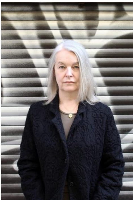
Marlene Streeruwitz

Marlene Streeruwitz „Handbuch für die Liebe.“ (2024) Wie kann in Zeiten des Krieges an die Rettung der Welt gedacht werden? Mit der Freiheit ihres Romandenkens zeigt Marlene Streeruwitz im „Handbuch für die Liebe.“ mögliche Fluchtwege aus dem unübersichtlichen Chaos der Gegenwart auf. Liebe gilt dabei als Antidot zum Krieg. „Was Liebe ist, wissen wir von Anfang an“, sie ist eine Grunderfahrung aus „der allerersten Zeit“ unserer Existenz. Diese Liebe – jenseits von patriarchaler Besetzung und romantischen Idealen – gilt es zu bewahren und als Fluchtweg in eine freie und demokratische Gesellschaft auszuweiten. In der Weiterführung ihres „Handbuchs gegen den Krieg.“ lässt sie uns an ihrer Denkbewegung teilhaben und beschreitet völlig neue Wege. Die Lesung ist für Herbst 2024 geplant.